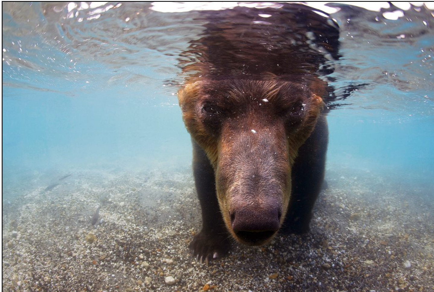
Immergé, un ours se prépare à festoyer. Ne manquent que les saumons rouges très attendus.