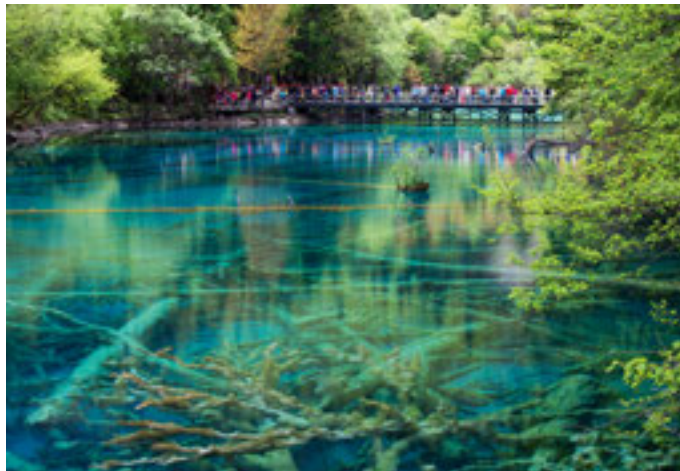
↑↑ Naturkunst. Die Verzasca im Tessin unter der Wasseroberfläche.

Es war 2009 in Island. Eigentlich wollte ich Lachse fotografieren, doch dann erzählte man mir von den tektonischen Spalten. Sie bieten unter Wasser eine völlig überraschende, fas-