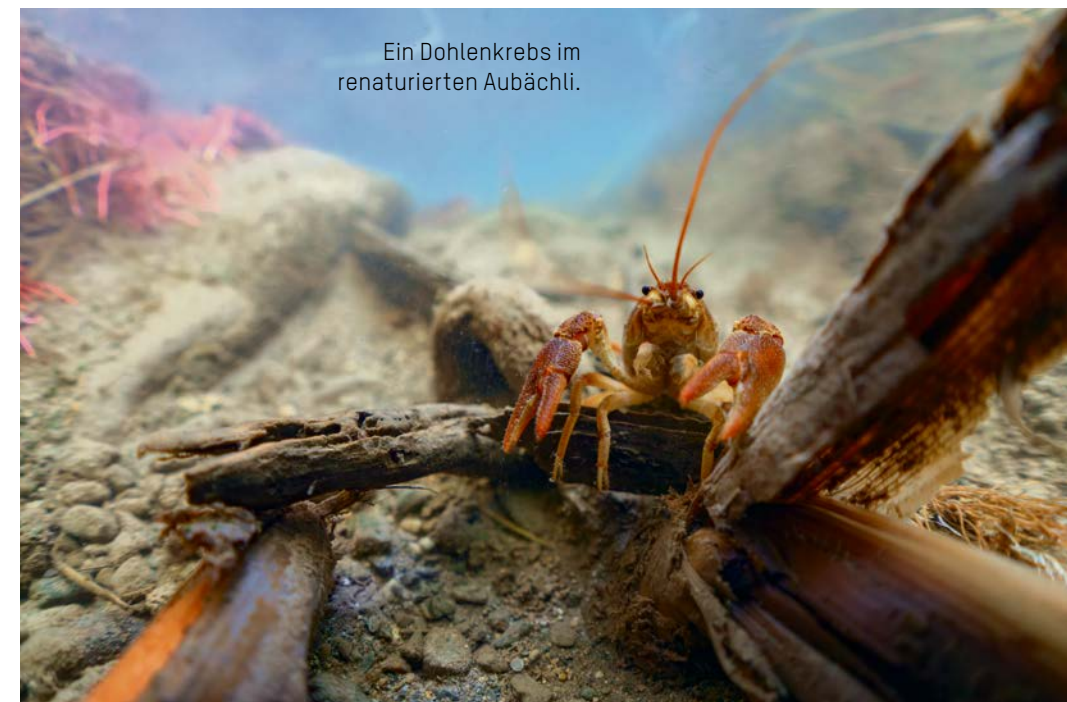
Ein Dohlenkrebs im renaturierten Aubächli.